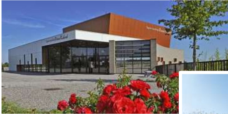
Construction de l'espace Pierre Richard – Faubourg de Cambrai Valenciennes

Exemple sur le territoire EQUIPEMENTS PUBLICS