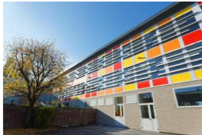
Réhabilitation de l'école Carpeaux - Anzin