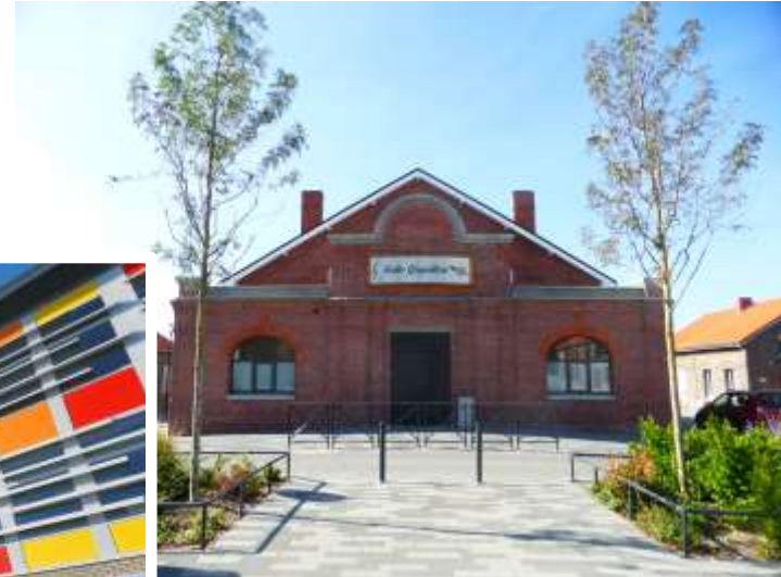
Réhabilitation de la salle des fêtes Goguillon – Cité Thiers ancienne Bruay-sur-l'Escaut